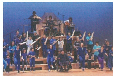
市民参加公演一例

音響の良さが評判の大・小ホール、フラットな会場のレセプションホール、展示室や会議室などを備える地下2階、地上5階の建物です。