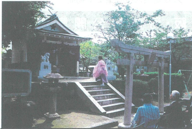
現代も毎年行われる河内額田・陰陽道「歴代組」の祭礼の様子 (陰陽師が祀っていた鎮宅霊符社にて/社殿には陰陽道の祈禱 呪符「五芒星」が見える)