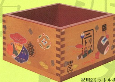
祝用2リットル箱 (本館蔵)

開館時間…10時～16時30分 休館日…日曜日、祝日 10月28日(日)・11月23日(祝)は開館 観覧料…無料