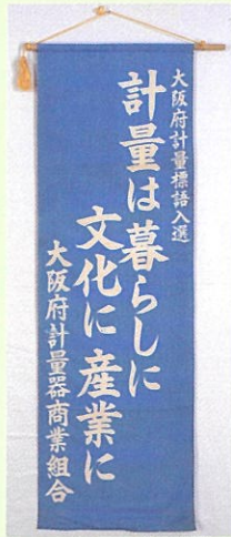
大阪府計量器商業組合(本館蔵)