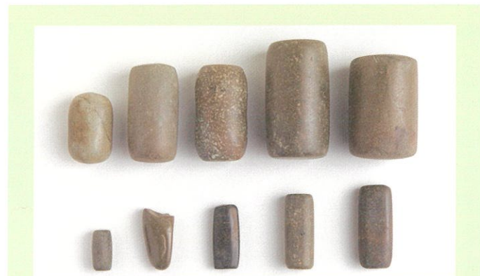
弥生分銅((公財)大阪府文化財センター蔵)