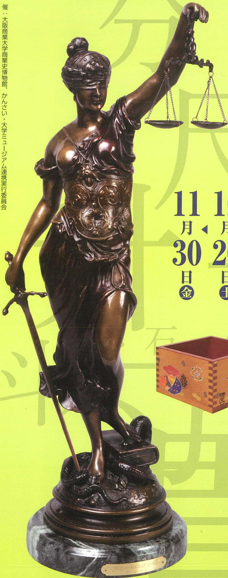
ブロンズ像 Goddess of Justice Themis(本館蔵)

開館時間…10時～16時30分 休館日…日曜日、祝日 10月28日(日)・11月23日(祝)は開館 観覧料…無料