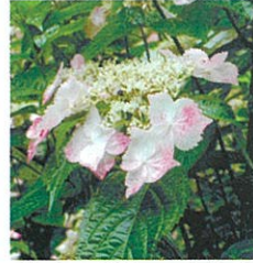
【ペニガクアジサイ】