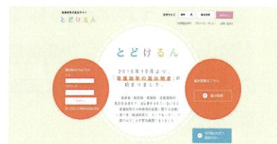
「とどけるん」のトップページ