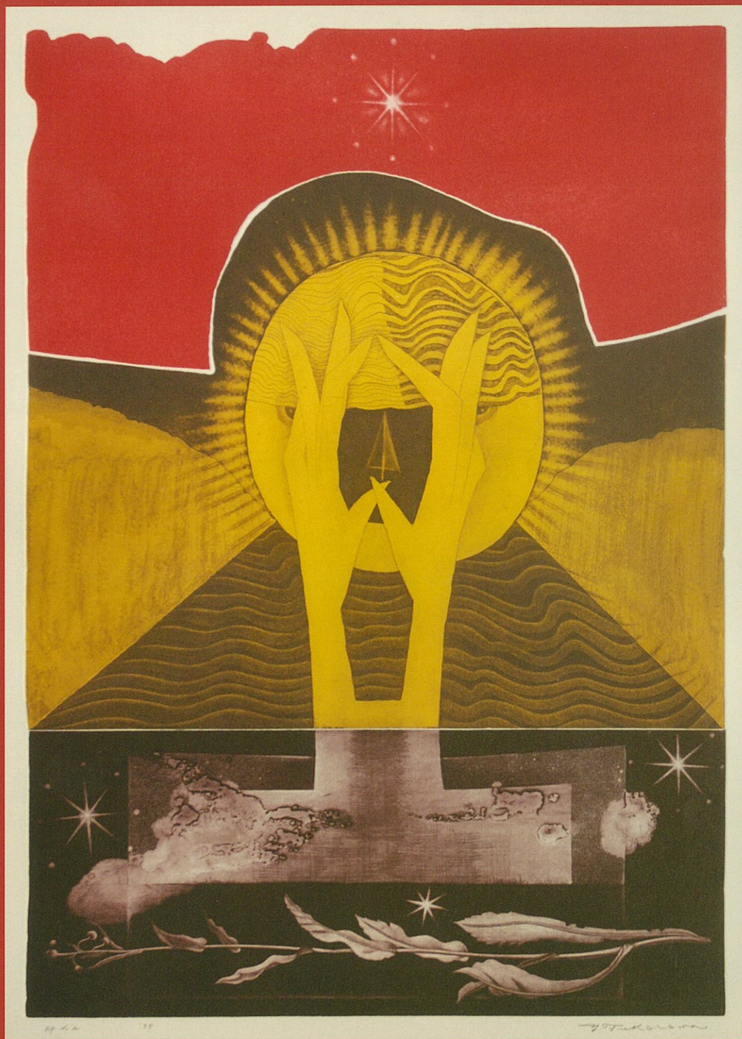
「影(折るインディオ)A」